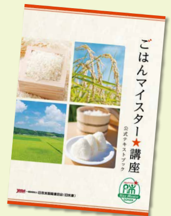
公式テキストブック (A4版 100頁)

申込方法 右のQRコードからwebでお申し込みください。 申込締切日は、各会場開催日の1か月前までです。